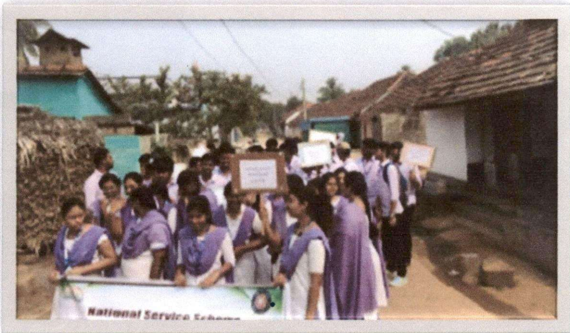
Awareness Rally on pollution caused by plastic usage