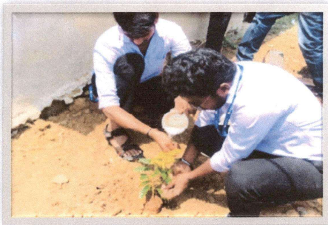
Students participating in Plantation