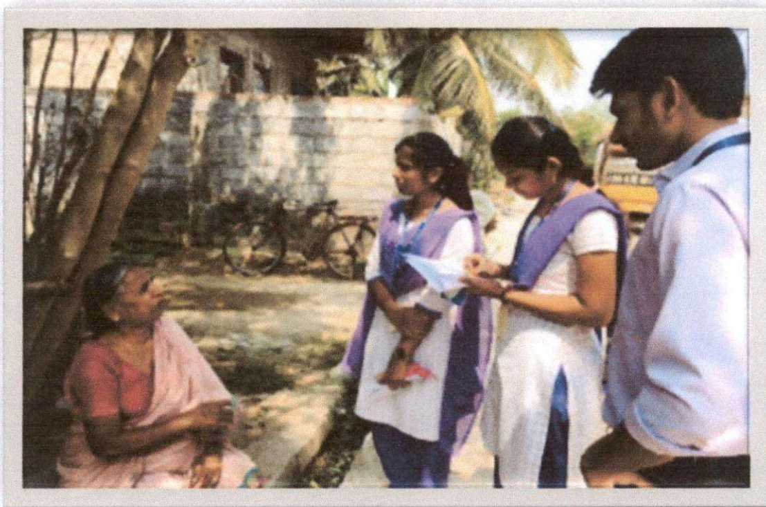
Conducting Literature Survey in Nayakam pally village