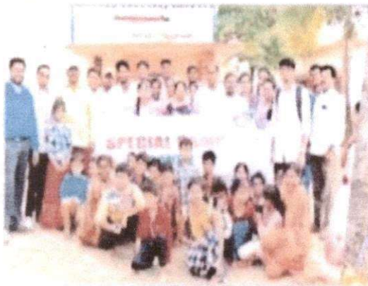
ఎస్.ఎస్.ఎస్ శిబిరంలో పాల్గొన్న విద్యార్థులు

ఉమ్మడి ప్రాంతం అంటే రేచేరు, తాళి, ముమ్మడి ఉమ్మడి, ఇంకా ప్రాంతం అంటారు. ఇంకా ప్రాంతం.